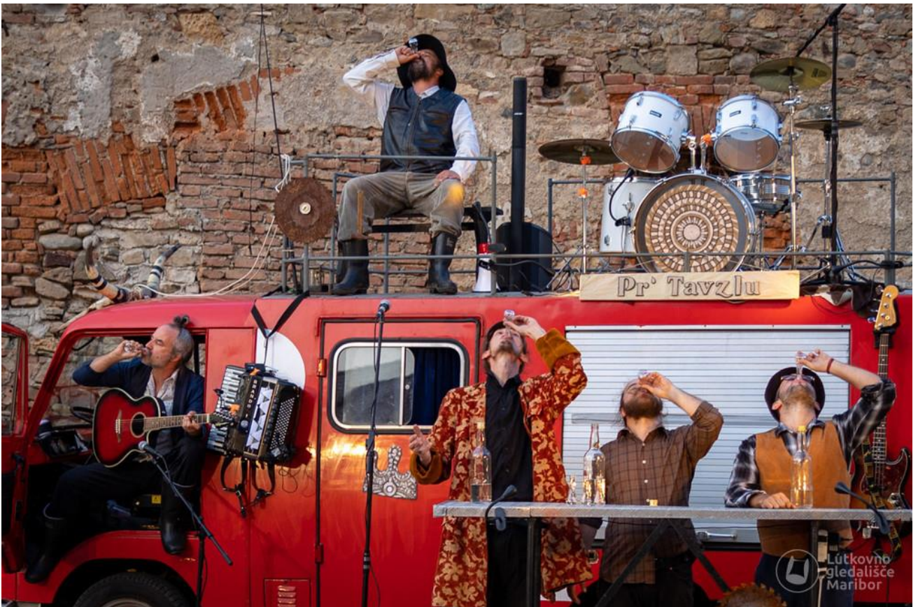
Festivalski utrinki.